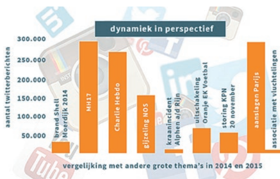
Figuur 3.1 Omvang van het berichtenverkeer op Twitter in de eerste 48 uur na de aanslagen in Parijs van 13 november 2015, afgezet tegen de omvang van het berichtenverkeer bij enkele eerdere incidenten die het Nederlandse publiek schokten. Als vergelijkingsmateriaal is daarbij ook een gebeurtenis van andere orde toegevoegd: de uitschakeling van het Nederlands elftal voor het EK van 2016. Afbeelding overgenomen uit: Eysink Smeets, Loeffen & Baars, 2016.

Tijdens of kort na een aanslag kan ook de ontwikkeling en inhoud van de berichtgeving op sociale media – zoals Twitter – een nuttige proxy bieden (zie figuur 3.1). Verder zullen bestuurders het moeten doen met hun eigen ‘samenlevingsantenne’, daarbij ongetwijfeld ondersteund door de eigen organisatie, organisaties als de NCTV, het NGB, politie en OM of door (lokale) maatschappelijke partners. Het is daarbij dan natuurlijk wel handig inzicht te hebben in de factoren die de impact van (dreigende) aanslagen in de samenleving beïnvloeden. Daarop gaan wij in dit hoofdstuk in.